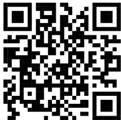
Hình 2: Các mẫu phiếu khảo sát và đề kiểm tra trước và sau thực nghiệm

26.0 và Microsoft Excel. Dữ liệu được thu thập thông qua hệ thống công cụ đa dạng: Bài kiểm tra đọc hiểu (trước và sau thực nghiệm), phiếu khảo sát mức độ hứng thú (thang Likert 5 mức), quan sát sự phạm và phỏng vấn sâu giáo viên, học sinh (xem Hình 2).