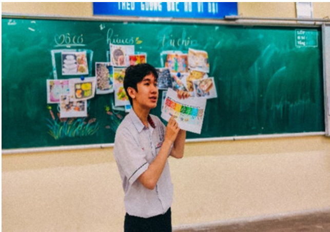
Hình 1: Học sinh thuyết trình về cách phân loại nhựa dựa trên các kí hiệu