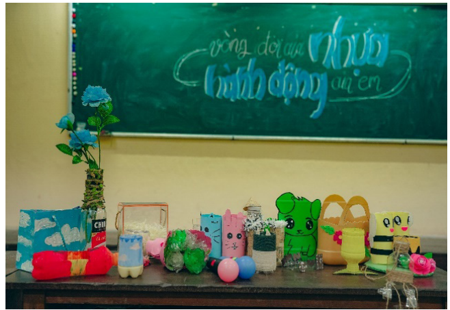
Hình 2: Một số sản phẩm thực hành tái chế nhựa của học sinh

thải nhựa được tổ chức (điểm trung bình = 4.51); Các hoạt động giáo dục về rác thải nhựa phù hợp với nội dung hoạt động trải nghiệm trong chương trình (điểm trung bình = 4.61); Giáo viên sử dụng các phương pháp và phương tiện dạy học phù hợp, phát huy được sự chủ động, tích cực, sáng tạo của học sinh (điểm trung bình = 4.52); Học sinh tích cực tham gia các hoạt động trải nghiệm giáo dục ứng phó rác thải nhựa mà giáo viên tổ chức (điểm trung bình = 4.50); Học sinh mong muốn được tổ chức nhiều hơn nữa các hoạt động trải nghiệm giáo dục giảm thiểu rác thải nhựa (điểm trung bình = 4.44).