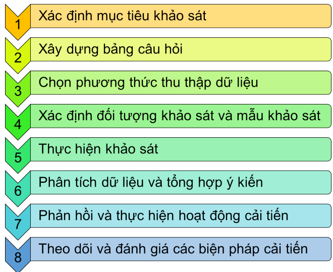
Hình 1: Quy trình triển khai hoạt động khảo sát lấy ý kiến cựu người học

Hiện nay, tại các trường đại học, hoạt động khảo sát lấy ý kiến cựu người học do Phòng Đảm bảo chất lượng chịu trách nhiệm thực hiện. Phòng Công tác sinh viên và các khoa đào tạo hỗ trợ, phối hợp thực hiện, thông qua các bước chung, cụ thể như Hình 1.