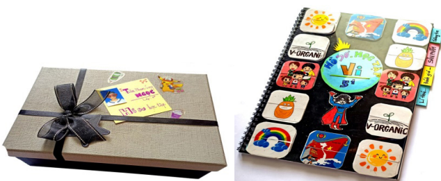
Hình 9: Hồ sơ học tập của học sinh tiểu học

Học sinh xây dựng và hoàn thiện hồ sơ học tập của mình. Dưới đây là hai mẫu bìa hồ sơ học tập do học sinh tiểu học thực hiện (xem Hình 9):