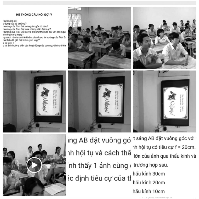
Hình 4: Chuyển giao nhiệm vụ

bè trong nhóm Facebook mà vẫn không thể giải quyết được các nội dung GV giao, các em có thể nhờ vào sự hỗ trợ của GV hướng dẫn thông qua nhóm Facebook.