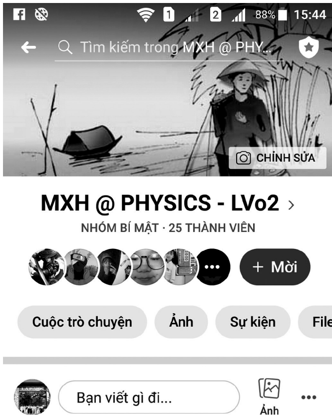
Hình 3: Nhóm Facebook học tập

GV theo dõi để hỗ trợ HS và định hướng để HS lựa chọn nội dung trả lời các nhiệm vụ học tập được chính xác.