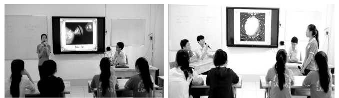
Hình 5: Báo cáo và phản biện sản phẩm nghiên cứu của HS

HS chuẩn bị và thực hiện các nội dung được GV phân công qua Facebook các nhóm tiến hành báo cáo kết quả theo thời gian định trước. Bên cạnh đó, các nhóm lần lượt trao đổi và đặt câu hỏi phản biện để nội dung của các nhóm đầy đủ và sâu sắc hơn.