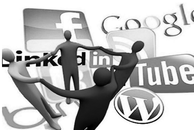
Hình 1: MXH

Theo Khoản 22, Điều 3, Nghị Định số 72/2013: "Mạng xã hội - social network (MXH) là hệ thống thông tin cung cấp cho cộng đồng người sử dụng mạng các dịch vụ lưu trữ, cung cấp, sử dụng, tìm kiếm, chia sẻ và trao đổi thông tin với nhau, bao gồm dịch vụ tạo trang thông tin điện tử cá nhân, diễn đàn (forum), trò chuyện trực tuyến (chat), chia sẻ âm thanh, hình ảnh và các hình thức dịch vụ tương tự khác".