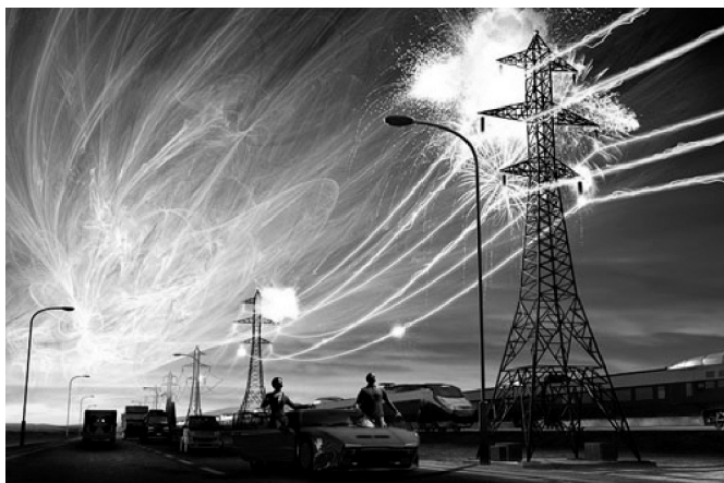
Hình 8: Ảnh hưởng của bão từ

Bão từ hay còn gọi là bão địa từ trên Trái Đất là những thời kì mà kim la bàn dao động mạnh. Nguyên nhân gây ra