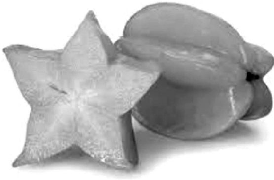
Hình 3: Minh họa bước 2

- GV: Chiếu hình ảnh tương ứng với từ (xem Hình 3).