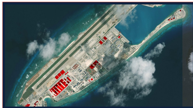
Hình 3: Trung Quốc bồi đắp, xây dựng trái phép trên Đá Chữ Thập, thuộc Quần đảo Trường Sa – Việt Nam