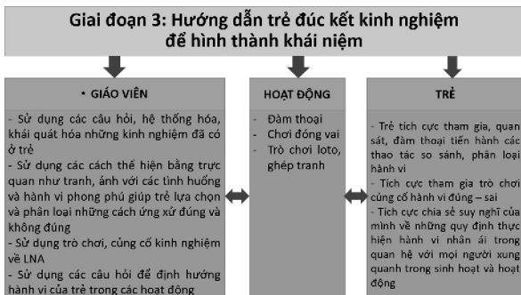
Hình 3: Hướng dẫn trẻ đúc kết kinh nghiệm để hình thành khái niệm

Đây là giai đoạn trẻ đúc kết rút ra bài học mới để tạo ra những hiểu biết mới về cách giải quyết và xử lý các mối quan hệ trong cuộc sống dựa trên những điều trẻ trải qua, tự rút ra bài học, quy tắc ứng xử. Đây là giai đoạn rất quan trọng để trẻ khắc sâu và có những hành động tích cực ở giai đoạn sau.