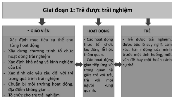
Hình 1: Trẻ được trải nghiệm

- Sử dụng các HĐ phong phú, hấp dẫn và phù hợp với khả năng, hứng thú, kinh nghiệm của trẻ ở trường MN như vui chơi, lao động, lễ hội, giao lưu, thăm quan, thăm hỏi...; các HĐ giao tiếp ứng xử trong quan hệ giữa trẻ với trẻ và với mọi người xung quanh. Các HĐ