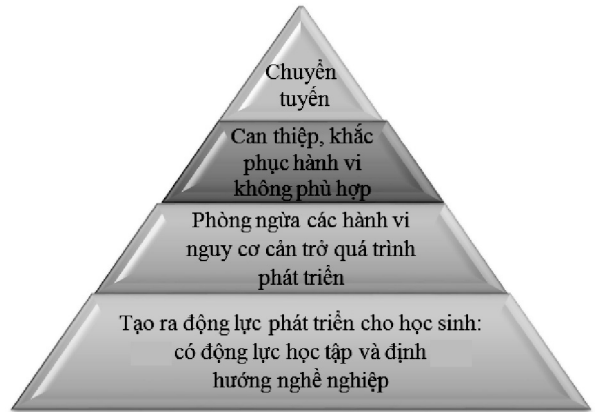
Hình 1: Các nhiệm vụ cơ bản của hoạt động tư vấn học đường

Dưới đây là những luận cứ căn bản để phân biệt rõ ràng hơn giữa chức năng, nhiệm vụ của cán bộ TVHĐ với chức năng, nhiệm vụ của người GV (GVCN, cán bộ Đoàn/Đội và GV bộ môn) trong công tác TVHĐ ở nhà trường phổ thông. Chính vì sự khác biệt đó, chúng ta cần đặt ra những yêu cầu riêng, cụ thể đối với cán bộ TVHĐ và GV phổ thông: